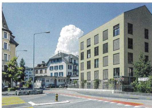
Einer der «traversa»-Standorte in Kriens: das Wohnhaus Sonnenbühl im Kupferhammer (Haus in der Mitte).

Die gute Vernetzung mit der Bevölkerung darf die Geschäftsleitung an den nachbarschaftlichen Treffen feststellen, die sie regelmässig organisiert.